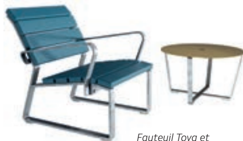
Fauteuil Toya et table de salon