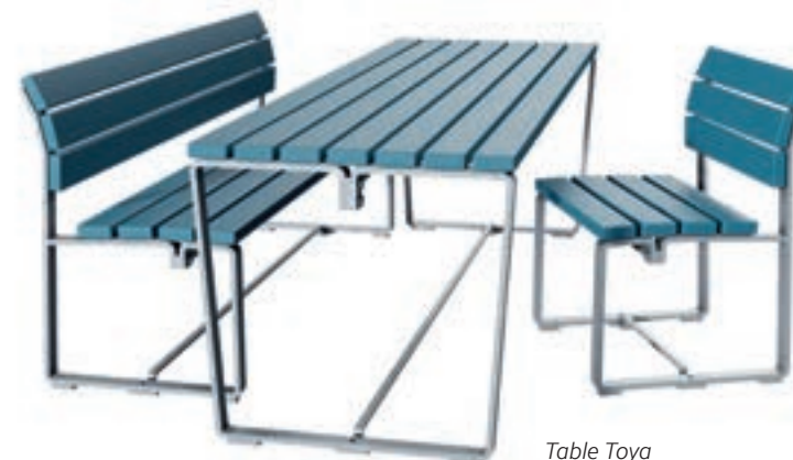
Table Toya avec banc et chaise