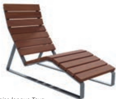
Chaise longue Toya