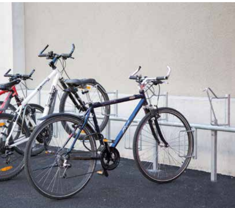
Type RXE, idéale si des enfants sont utilisateurs

Les produits sont constitués de deux pinces à vélos qui assurent un maintien protecteur des vélos : type KD pour un accès direct (position basse), type KX pour accrocher la jante (position haute).