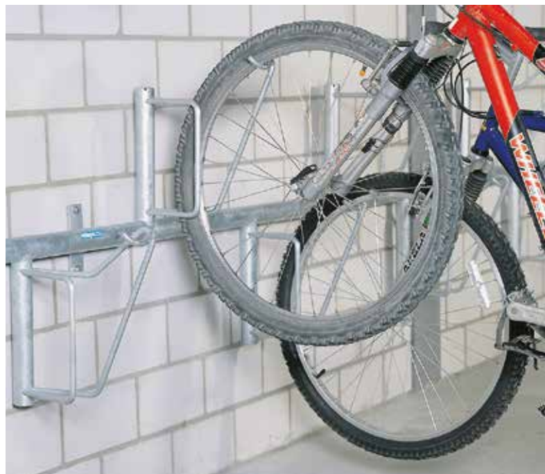
Type RZE – la traverse tubulaire spéciale pour vélos d'adultes sportifs