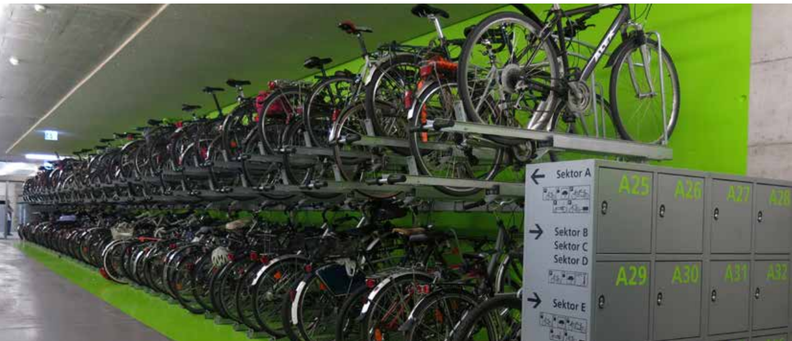
Étage'2' double la surface de parking. Bien adapté pour les parkings de toutes tailles.

Velopa AG est considérée comme une pionnière dans le domaine des rangements de vélos à deux étages. La toute nouvelle innovation: Etage'2' convainc par une optique allégée et épurée. Cette élégante construction en acier galvanisé à chaud est conçue pour l'usage quotidien dans des installations publiques de parking à vélos.