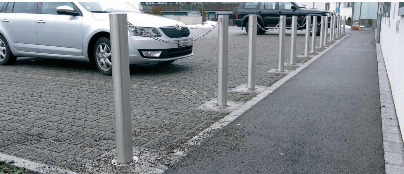
L'acier inoxydable est la solution intelligente pour délimiter les zones piétonnes, les parkings, les rues privées, les esplanades de garage, etc.

Ce potelet de haute qualité, en acier inoxydable (acier chromé), apporte en tout lieu une touche de noblesse. Sa partie supérieure plate est une caractéristique particulièrement intéressante. Loki est verrouillable dans la douille de sol.