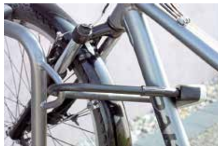
Anneaux de sécurité soudés pour la protection contre le vol