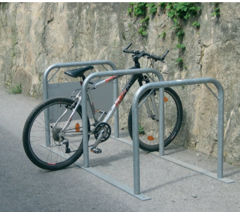
La roue peut être positionnée sur place en fonction des besoins (90° à +/- 45°)

Parc à vélos mobile et pliable, idéal pour la mise à disposition temporaire de places de parking pour vélos. Pour économiser de l'espace, Velopa Libera peut être plié, transporté ou stocké.