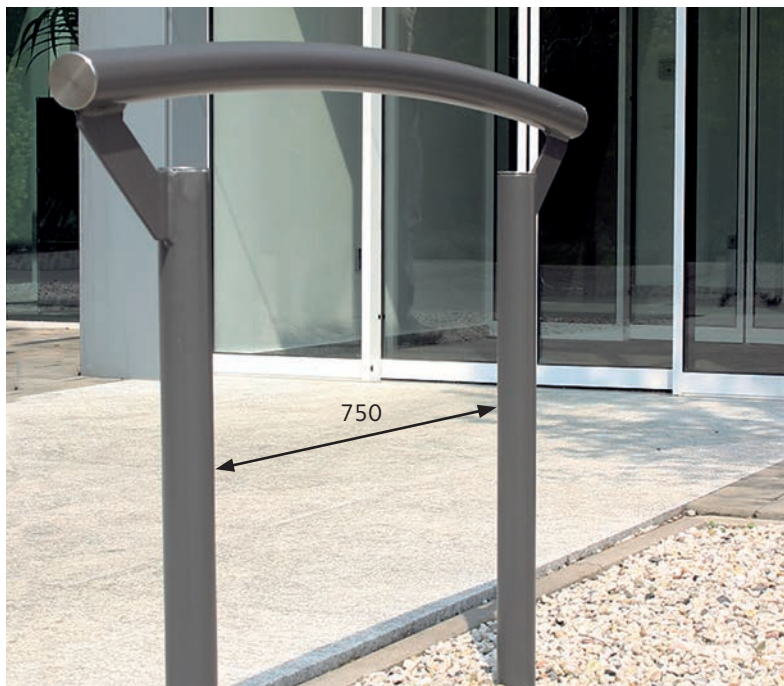
Un bel objet devant chaque porte

La forme de l'arceau d'appui pour vélos a été conçue suivant la forme des abris à vélos du système BWA bausystem®. Dans le cas de plusieurs arceaux, on peut choisir des écarts latéraux, en fonction de l'espace à disposition, entre 80 et 110 cm.