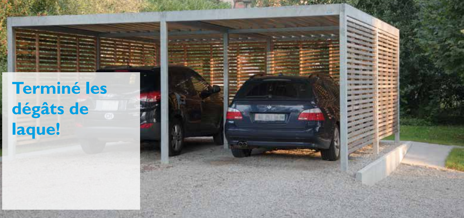
Quadro, l'abri de voiture, parois en lamelles de bois