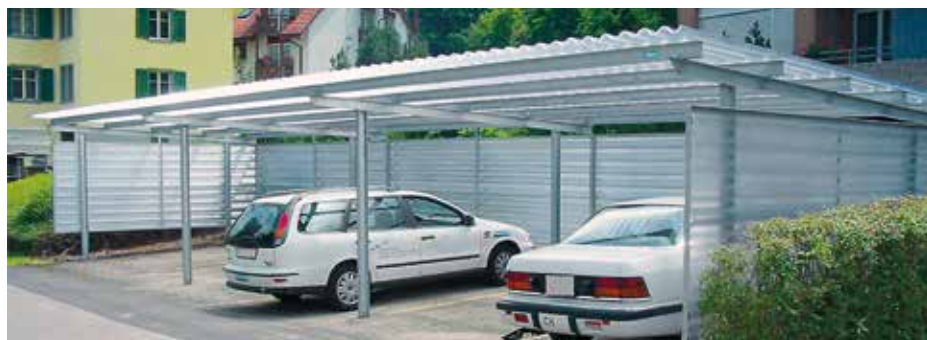
Carport avec toit et parois en polycarbonate translucide

Deux longueurs d'éléments peuvent être assemblées pour 1 voiture (2.5 m) et 2 voitures (5 m). Il est aussi possible de choisir entre deux profondeurs de toit.