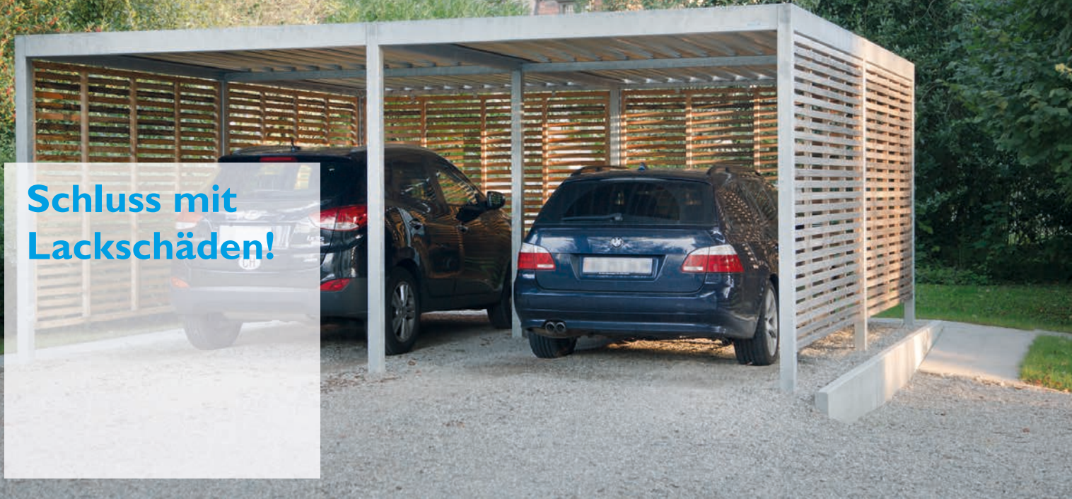
Carport Quadro, Wände z.B. aus edlen, unbehandelten Holzlamellen