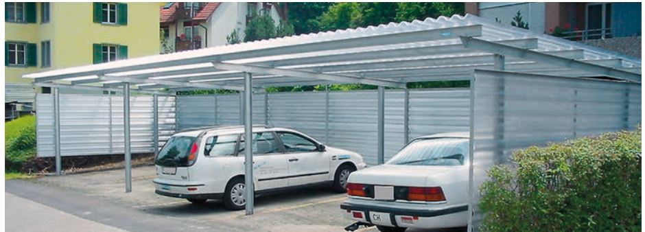
Carport Pultdach, Dach und Wände lichtdurchlässig

Die Überdachung mit dem klarem Stil entspricht dem heutigen Architekturtrend. Carport Quadro ist bezüglich der Grundfläche von 2.85 m x 5.70 m pro Auto komfortabel. Die Elemente können beliebig zusammengebaut werden. Quadro kann nach Wunsch mit Wänden oder auch mit einem Sektionaltor ausgestattet werden. Stahlkonstruktion feuerverzinkt, Bedachung in Stahl-Trapezblech, Entwässerung in Dachrahmen integriert. Weitere Anwendungen vom System Quadro siehe Seite 29.