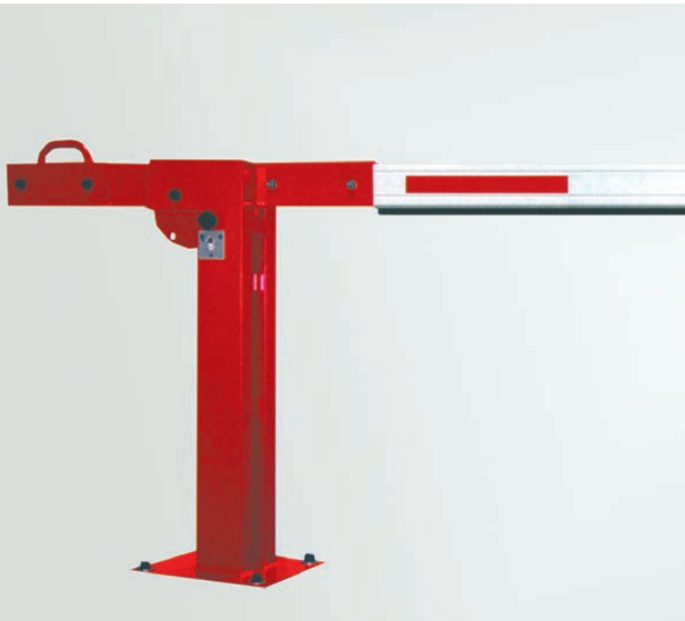
Zuverlässige Handbarriere mit optimalen Laufeigenschaften

Die Velopa Handbarriere ist eine formschöne, einfach zu bedienende Schranke für verschiedenste Sperrbreiten. Barrierenständer in Stahlkonstruktion, verzinkt und pulverbeschichtet in RAL 3002 (Karminrot). Besonders breiter Aluminiumbaum (100 x 50 mm).