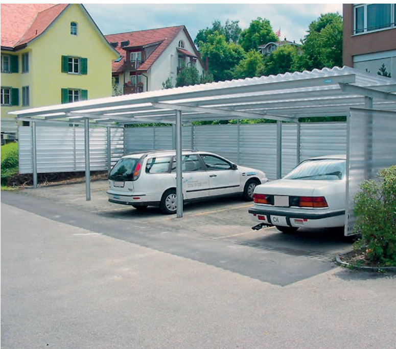
Carport Pultdach, Dach und Wände lichtdurchlässig

Zweckmässige, feuerverzinkte Stahlkonstruktion mit dezentem Pultdach. Zwei Dachtiefen und zwei Dachbreiten stehen zur Wahl: 2.50 m für 1 Auto, 5.00 m für 2 Autos.