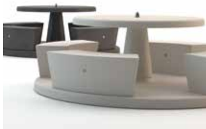
Combinaison table-bancs Icaro