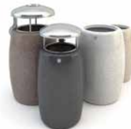
Poubelle Orione et Pegaso