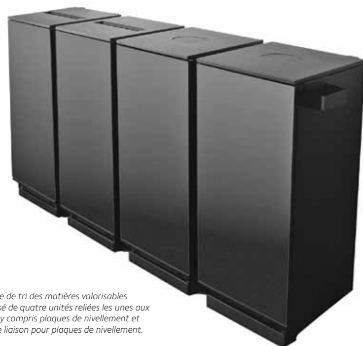
Système de tri des matières valorisables composé de quatre unités reliées les unes aux autres, y compris plaques de nivellement et tôles de liaison pour plaques de nivellement.

En fonction des besoins et des préférences individuelles, il est possible d'ajouter des accessoires individuels aux conteneurs Tersus, tel un collecteur de piles ou de vieux papiers. Des collecteurs de verre et de PET ainsi que des déchiqueteuses de documents peuvent également être intégrés. Le système de contrôle Waste Access garantit en outre l'accès au seul utilisateur autorisé. Tersus, le futur ambassadeur de la propreté, du style et du recyclage moderne dans votre bureau.