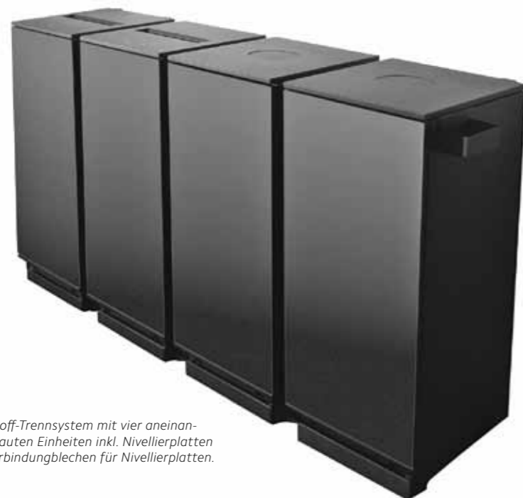
Wertstoff-Trennsystem mit vier aneinanderggebauten Einheiten inkl. Nivellierplatten und Verbindungblechen für Nivellierplatten.

Je nach Bedarf und persönlicher Vorliebe lassen sich Tersus-Behälter mit individuellem Zubehör wie Batterie- oder Papiersammler erweitern. Auch Glas- und PET-Sammler oder Aktenvernichter können perfekt integriert werden. Das Waste-Access-Kontrollsystem stellt zudem sicher, dass nur der berechtigte Nutzer Zugang hat. Tersus, Ihr künftiger Botschafter für Sauberkeit, Stil und zeitgemässes Rezyklieren im Büro.