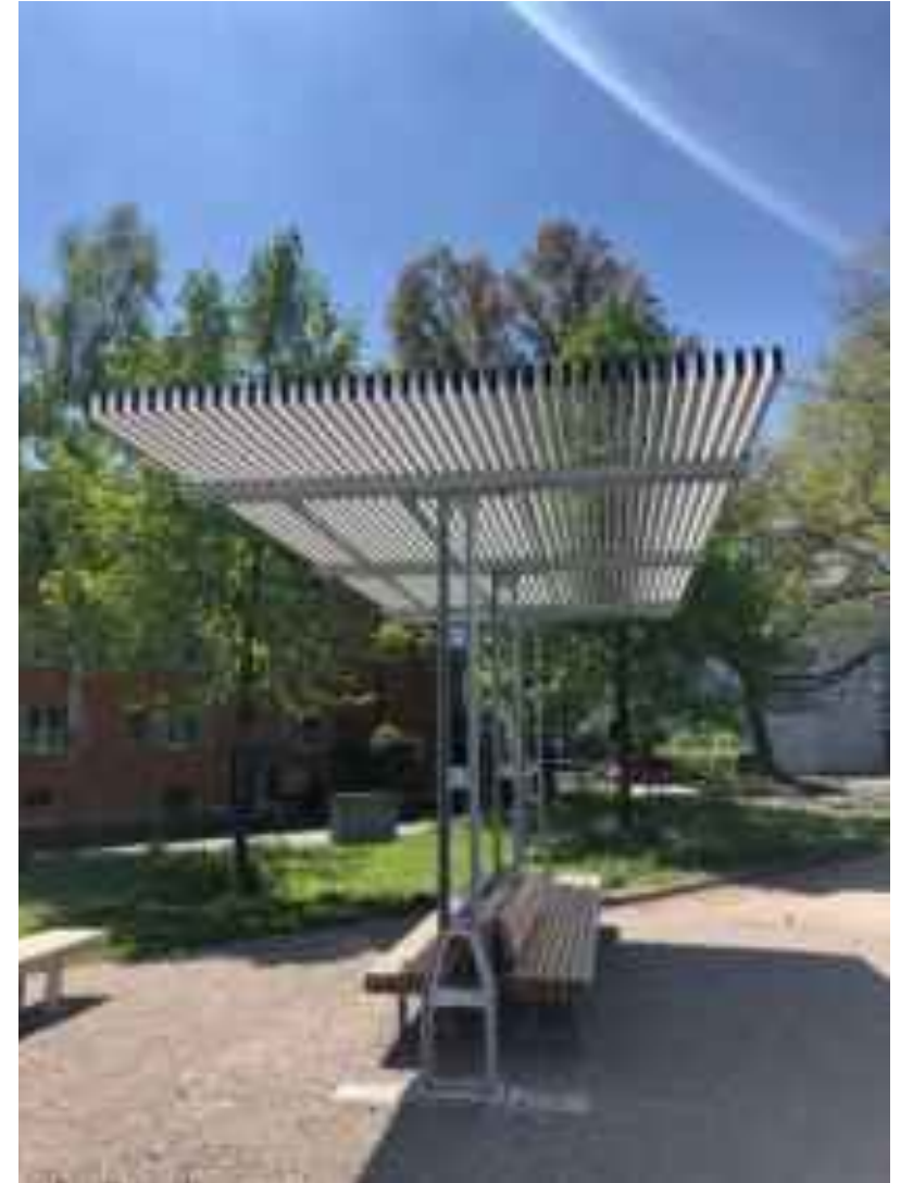
Ökologische Bauweise & Bestimmung