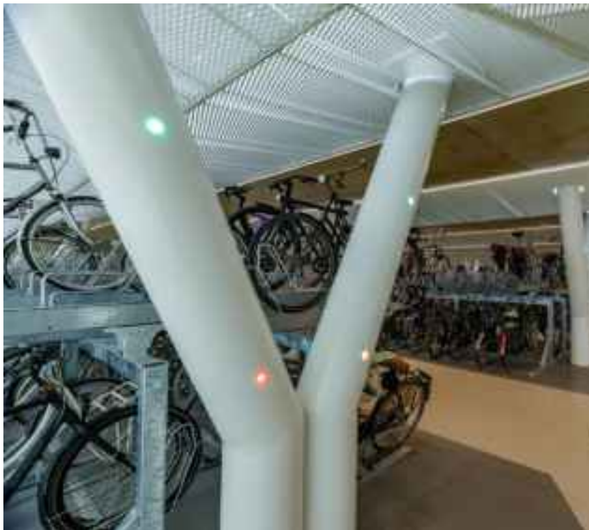
Österreichische Bundesbahnen AG