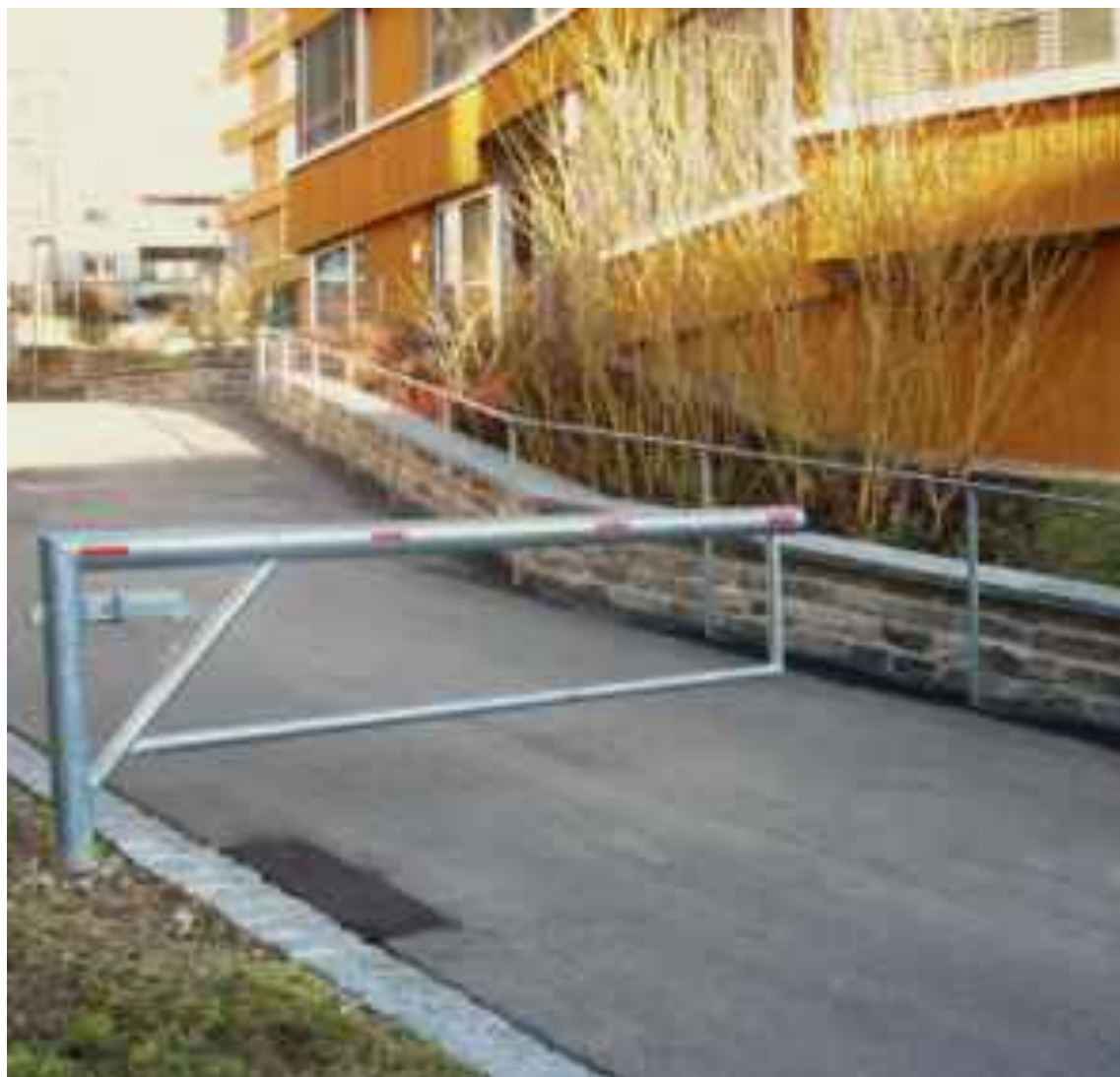
Ökologische Barriere für Radfahrer