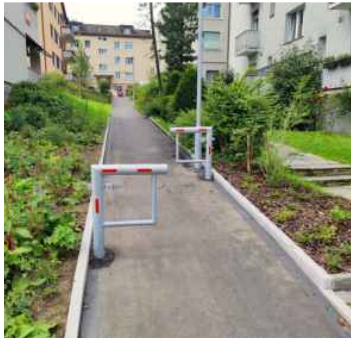
Ökologische Barriere für Radfahrer