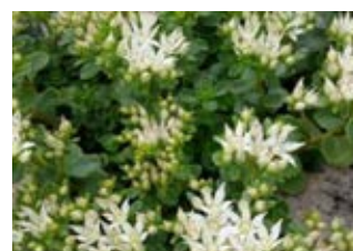
Orpin bâtard «Album Superbum» (Sedum Spurium album superbum) Croissance 10-15 cm Floraison mai-septembre