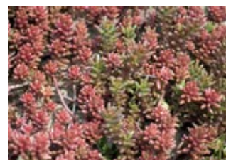
Orpin d'Espagne (Sedum hispanicum) Croissance 5-10 cm Floraison juin-août