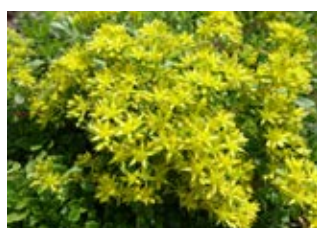
Orpin du Kamtchatka (Sedum Kamtschaticum) Croissance 12-15 cm Floraison juin-septembre