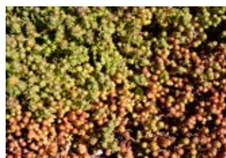
Orpin lydium (Sedum lydium) Croissance 5-10 cm Floraison juin-juillet