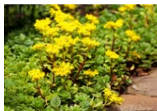
Orpin âcre (Sedum acre) Croissance 5-15 cm Floraison mai-août

10-12 plants de sédum (choix et nombre en fonction de la saison et de la disponibilité)