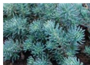
Orpin des rochers (Sedum Reflexum blue spruce) Croissance 10-15 cm Floraison juillet-août