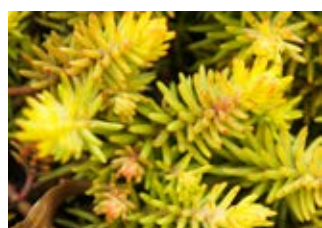
Orpin de Forster (Sedum forsterianum) Croissance 15-30 cm Floraison juin-août