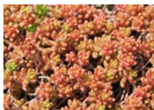
Orpin vivace (Sedum album coral carpet) Croissance 5-10 cm Floraison juin-juillet