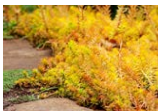
Orpin réfléchi «Angelina» (Sedum Reflexum angelina) Croissance 10-15 cm Floraison mai-juillet