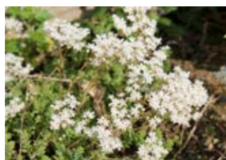
Orpin blanc (Sedum album) Croissance 8-20 cm Floraison juin-juillet