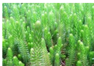
Orpin des rochers (Sedum Reflexum green spruce) Croissance 10-20 cm Floraison juillet-août