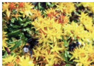
Orpin mongol (Sedum hybridum)

Croissance 10-15 cm Floraison juin-septembre