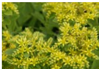
Orpin de Takeshima (Sedum Takesimense)

Croissance max. 40 cm Floraison juillet-septembre