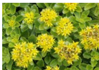
Sedum floriferum (Sedum floriferum) Croissance 10-15 cm Floraison juin-juillet