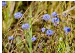
Jasione des montagnes (Jasione montana)

Famille composacées Couleur jaune Floraison mai-juin