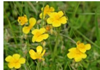
Hélianthème à feuilles arrondies (Helianthemum nummularium)

Famille plantaginacées Couleur bleue Floraison juin-juillet