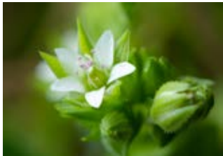
Sabline à feuilles de serpolet (Arenaria serpyllifolia)

Famille composacées Couleur jaune Floraison juin-septembre