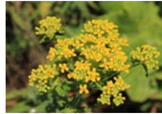
Alysson à calices persistants (Alyssum alyssoides)

Famille amaryllidacées Couleur violette Floraison juillet-août