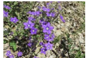
Miroir de Vénus (Legousia speculum-veneris)

Famille linacées Couleur bleue Floraison mai-juillet