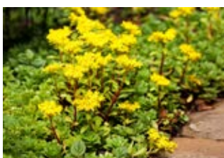
Orpin âcre (Sedum acre)

Famille lamiacées Couleur violette Floraison mai-août