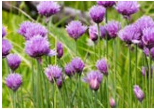
Ciboulette (Allium schoenoprasum)

20-25 espèces d'herbes et 4-6 plants de sédum (choix et nombre en fonction de la saison et de la disponibilité)