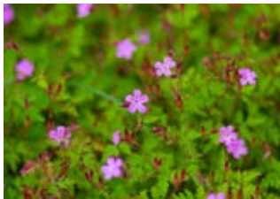
Géranium herbe à Robert (Geranium robertianum)

Famille géraniacées Couleur rose Floraison juin-octobre