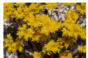
Orpin des rochers (Sedum rupestre)

Famille crassulacées Couleur jaune Floraison juin-septembre