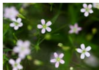
Œillet prolifère (Petrorhagia prolifera)

Famille papavéracées Couleur rouge, orange Floraison mai-août