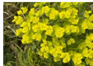
Euphorbe petit cyprès (Euphorbia cyparissias)

Famille caryophyllacées Couleur rose, rouge Floraison juin-juillet