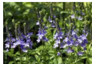
Véronique germandrée (Veronica teucrium)

Famille lamiacées Couleur violette, rose Floraison juin-août