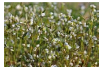
Drave printanière (Draba verna)

Famille gentianacées Couleur bleue Floraison juillet-août