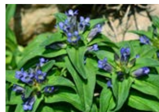
Gentiane croisette (Gentiana cruciata)

Famille rosacées Couleur blanche Floraison mai-juillet