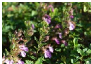
Germandrée petit chêne (Teucrium chamaedrys)

Famille caryophyllacées Couleur blanche, jaune Floraison mai-septembre