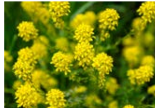
Biscutelle (Biscutella laevigata)

Famille caryophyllacées Couleur blanche Floraison mai-octobre