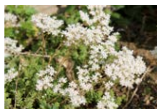
Orpin blanc (Sedum album)

Famille crassulacées Couleur jaune Floraison mai-août