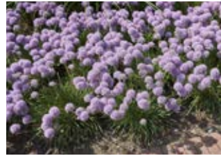
Ail des montagnes (Allium senescens)

Famille amaryllidacées Couleur violette Floraison mai-juillet