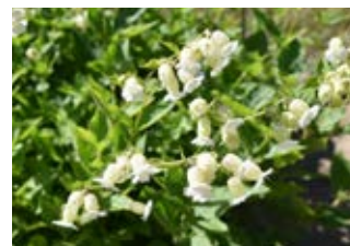
Silène enflé (Silene vulgaris)

Famille caryophyllacées Couleur blanche Floraison juin-juillet