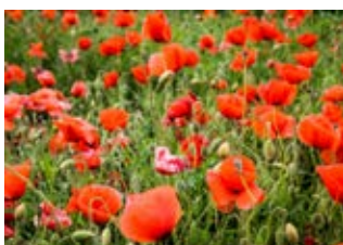
Pavot douteux (Papaver dubium)

Famille campanulacées Couleur violette Floraison juin-août