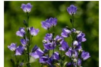
Campanule à feuilles rondes (Campanula rotundifolia)

Famille caryophyllacées Couleur rose Floraison juillet-août