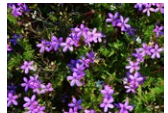
Bec-de-grue commun (Erodium cicutarium)

Famille euphorbiacées Couleur jaune Floraison avril-juillet