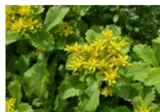
Orpin du Kamtchatka (Sedum Kamtschaticum)

Famille crassulacées Couleur blanche Floraison juin-juillet