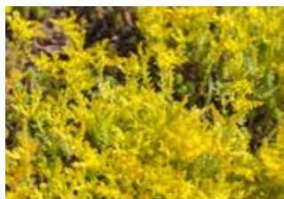
Orpin doux (Sedum sexangulare)

Famille crassulacées Couleur jaune Floraison juin-juillet