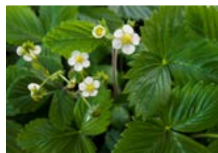
Fraisier des bois (Fragaria vesca)

Famille rosacées Couleur blanche Floraison juin-juillet