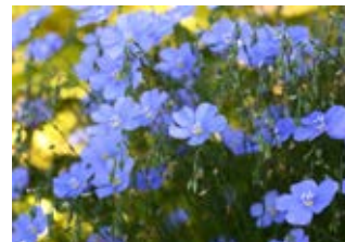
Lin d'Autriche (Linum austriacum)

Famille campanulacées Couleur bleue Floraison juin-août