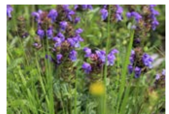
Brunelle à grandes fleurs (Prunella grandiflora)

Famille rosacées Couleur jaune Floraison mars-juin