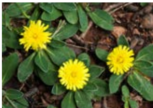
Piloselle (Hieracium pilosella)

Famille composacées Couleur jaune Floraison juillet-octobre