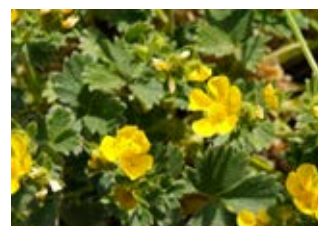
Potentille du printemps (Potentilla neumanniana)

Famille caryophyllacées Couleur violette Floraison juin-septembre