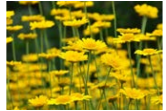
Anthémis des teinturiers (Anthemis tinctoria)

Famille crucifères Couleur jaune Floraison avril-juin