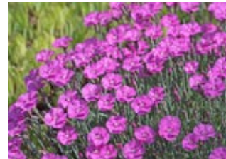
Œillet arméria (Dianthus armeria)

Famille crucifères Couleur jaune Floraison mai-août