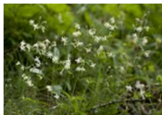
Silène des prés (Silene nutans)

Famille crassulacées Couleur rose Floraison juin-juillet