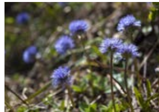
Globulaire commune (Globularia bisnagarica)

Famille géraniacées Couleur rose Floraison juin-octobre