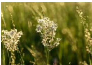
Filipendule commune (Filipendula vulgaris)

Famille géraniacées Couleur violette, rose Floraison avril-octobre