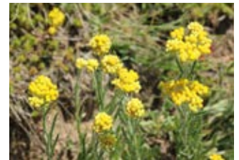
Immortelle (Helichrysum arenarium)

Famille cistacées Couleur jaune Floraison mai-juillet