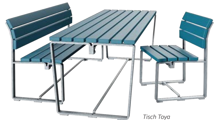
Tisch Toya mit Sitzbank und Stuhl