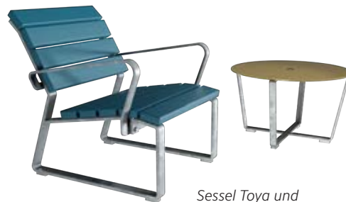
Sessel Toya und Loungetisch