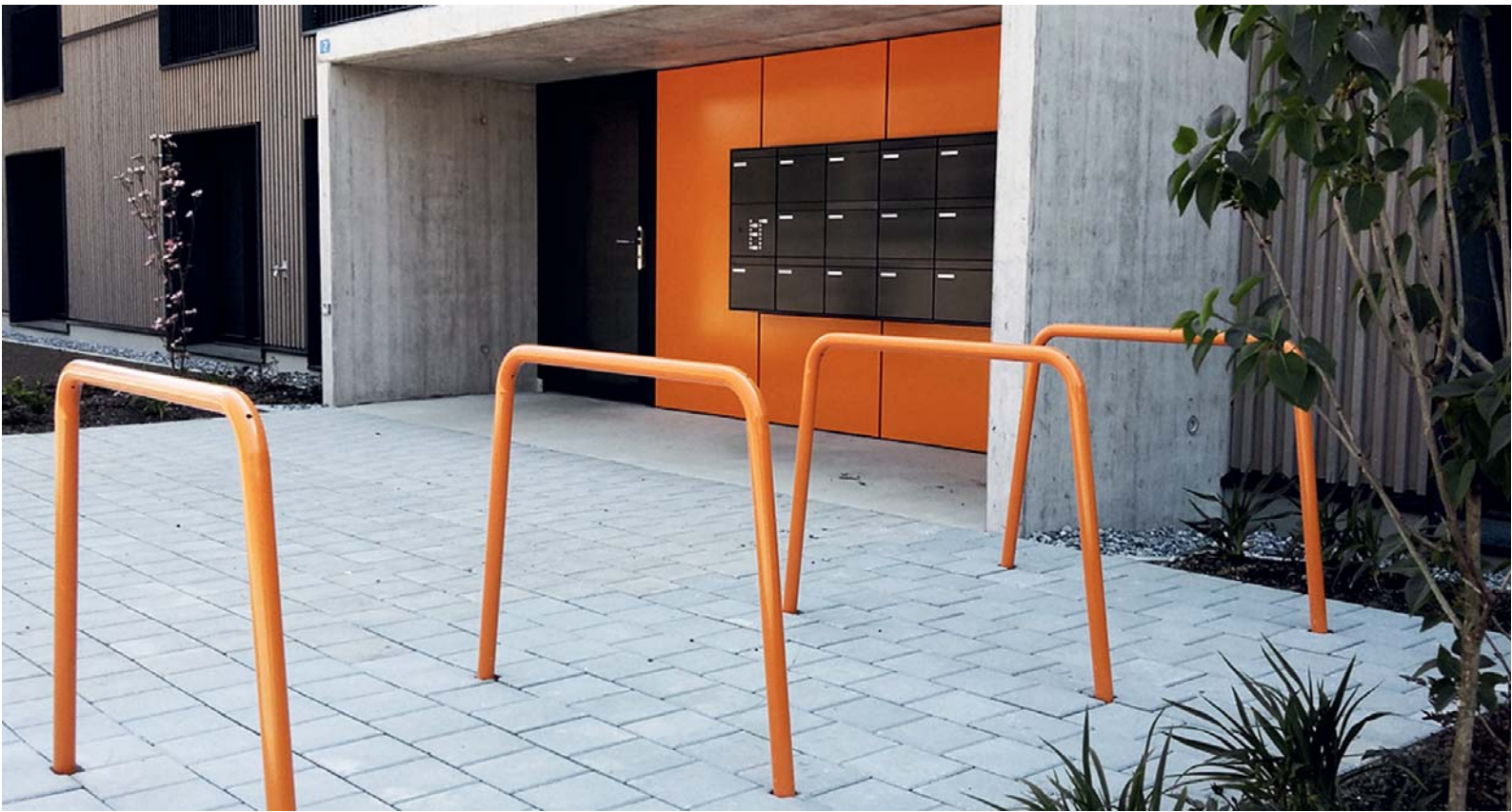
Weder Typ A