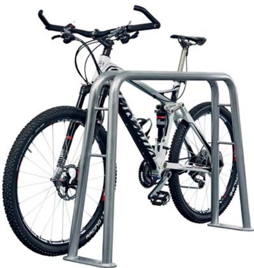
Weder Typ AD - Doppelbügel