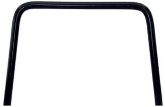
Weder Typ A – mit Velo-Protect schwarz