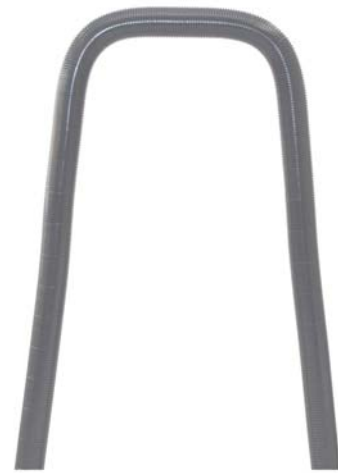
Weder Typ K – mit Velo-Protect grau