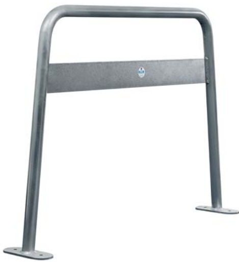
Weder Typ AW - Variante Werbebügel