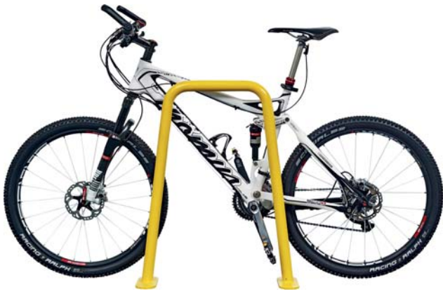
Weder Typ K