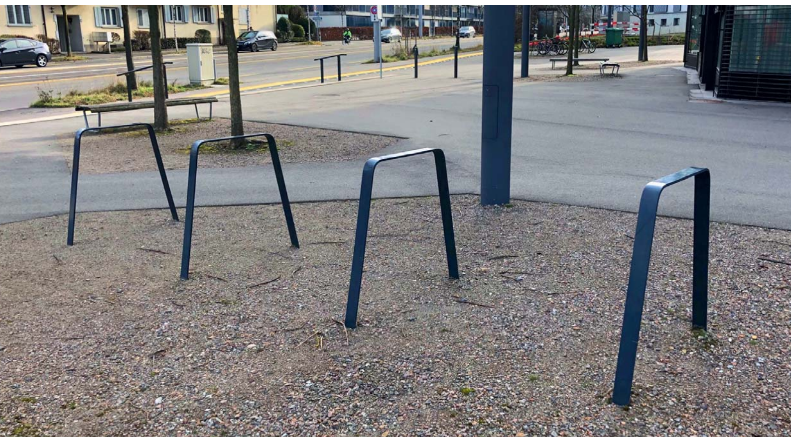
Trapezio - Typ A