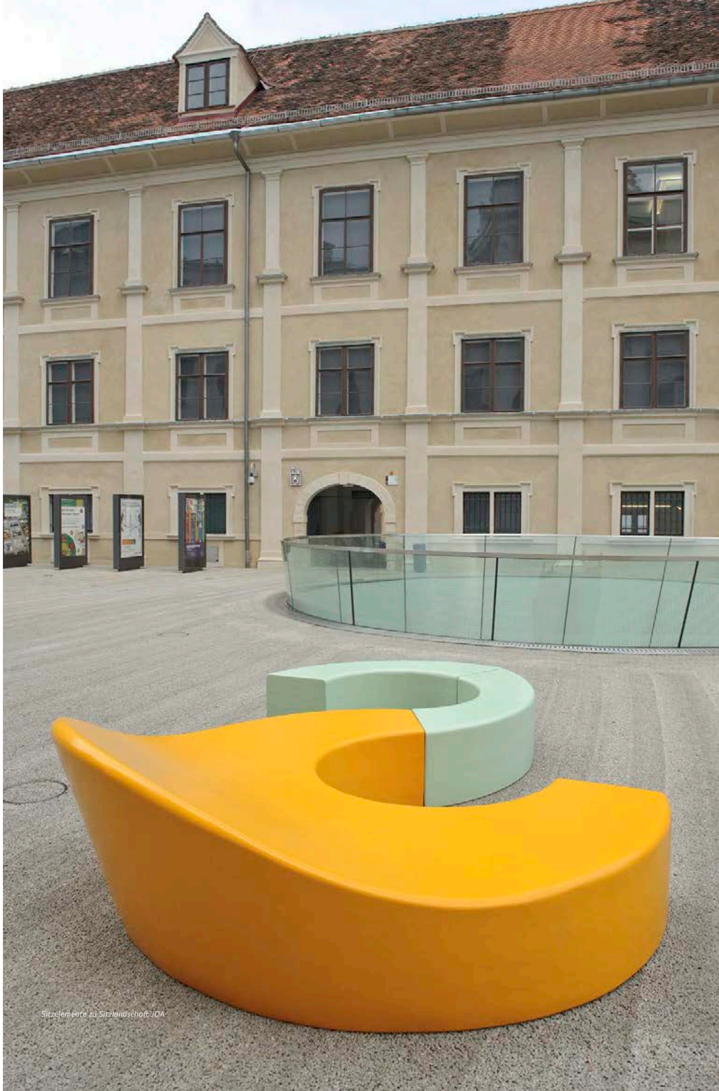
Sitzelemente zu Sitzlandschaft JOA